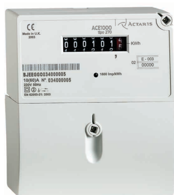
▶ ACE1000 tipo 270

El ACE1000 tipo 270 de Actaris es un contador estático monofásico de energía activa para la medida y facturación del consumo residencial, de formato extremadamente compacto. Es el contador más reciente de la larga y acreditada gama de productos de Actaris para aplicaciones residenciales.